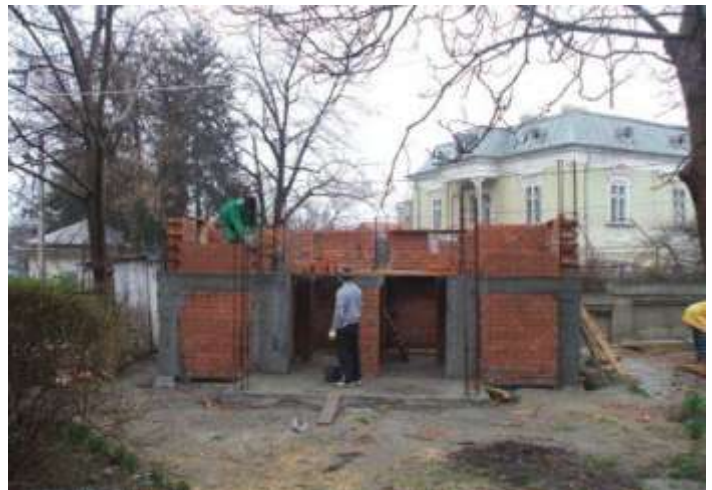
Imagini din timpul construcției