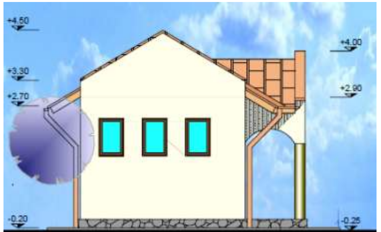
Façade Vest și Sud ale construcției propuse, conform proiectului tehnic